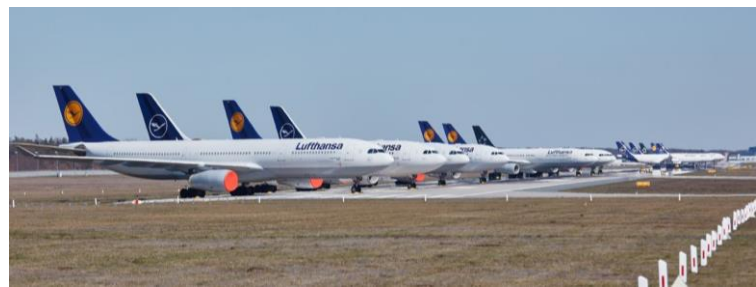
LFZ-Parkpositionen auf der Landebahn Nordwest am Verkehrsflughafen Frankfurt/Main